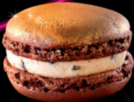
Macaron chocolat aux éclats de truffe poudré d'or