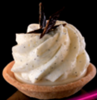
Tartlette de chocolat blanc à la vanille de Bora Bora